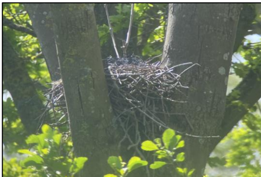
Figuur 3 Zwarte kraaiennest.