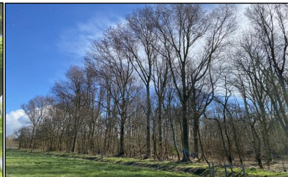
Figuur 4 Goed overzichtelijk struweel en bomen gedurende het bezoek in maart 2023.