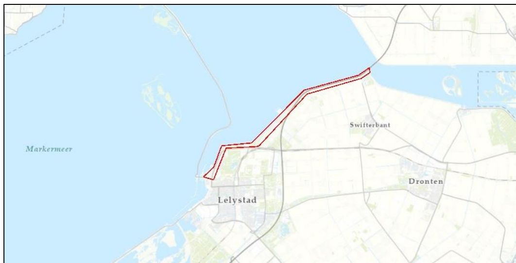
Figuur 1 Globale ligging van het plangebied (rood omkaderd) aan de noordkust van Flevoland.

De dijk en het aangrenzende groen was met name in maart goed te overzien (Figuur 4) en daarbij zijn diverse nesten gevonden (Figuur 2). De meeste nesten bleken tijdens latere bezoeken in het broedseizoen niet in gebruik te zijn. De enige grotere nesten die in gebruik waren werden door twee paar zwarte kraai (Figuur 3), één paar ekster en één paar buizerd gebruikt. Voor de zwarte kraai en ekster geldt dat de nesten beschermd zijn op het moment dat ze in gebruik zijn. De nesten van deze soorten genieten géén jaarrond beschermde status, tenzij er zwaarwegende ecologische redenen zijn, wat in onderhavige situatie niet het geval is.